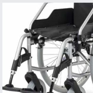
Sitzhöhe vorne variabel