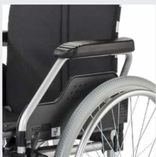
Seitenteil mit Komfortentnahme