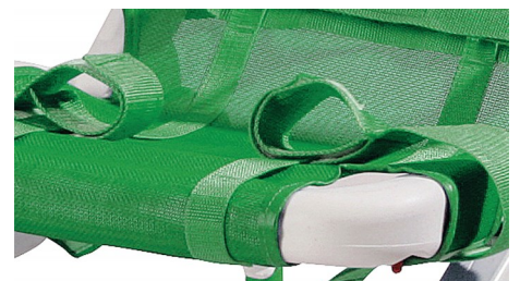
Ιμάντες στήριγματος ποδιών.