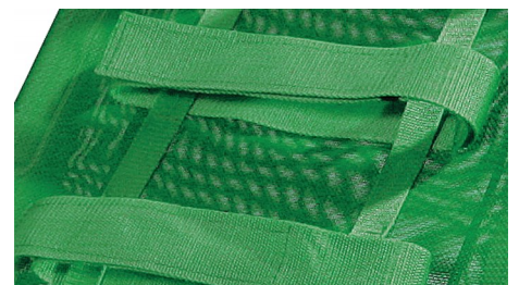
Άνετο αφαιρούμενο ύφασμα.