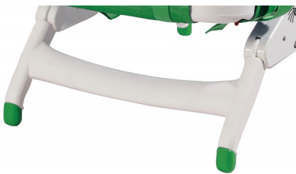
Ρυθμιζόμενα πόδια που δεν γλιστρούν.