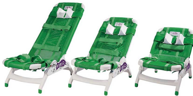
LARGE – MEDIUM – SMALL