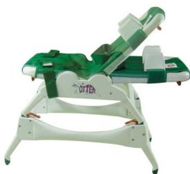
Ρυθμιζόμενη πλάτη 0° – 90°